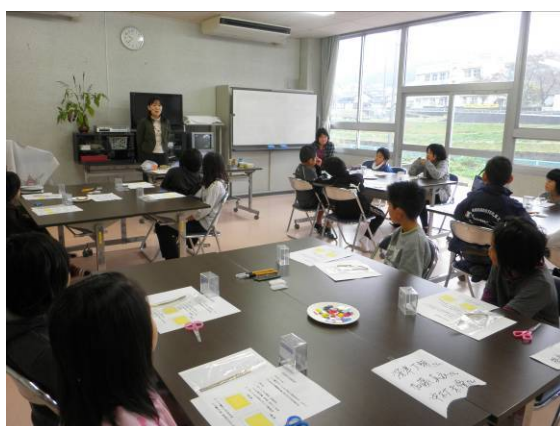
話を聞いています！