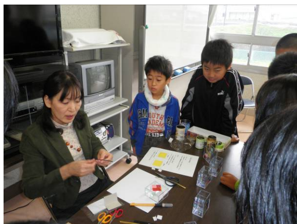
リード線は難しい…

まずフィルムの色選び！みんながそれぞれに個性が出ていて大人では考えつかないようなキレイな色合わせでした。