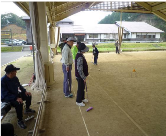
みなさん真剣です

なかなか多世代の参加できるスポーツが無いなか、出来ることなら、来年度以降も続けていきたいと思えます。参加者の皆さん大変ご苦勞様でした。