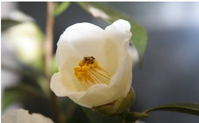
椿の花 撮影場所:コア周辺 撮影日:平成23年年末