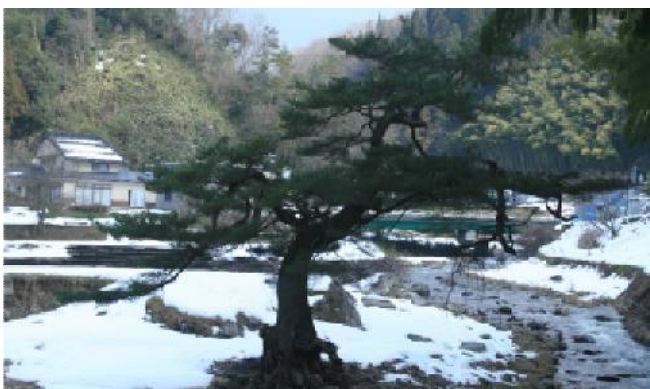
平岩健康広場の一本松 平成24年1月14日撮影