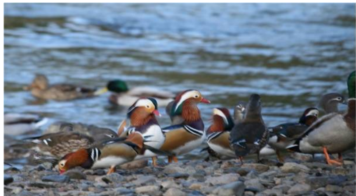
オシドリ 場所:水力発電所付近 撮影日:平成23年年末