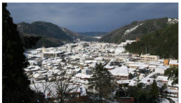
忠霊塔から眺めた掛合の町 平成24年1月14日撮影