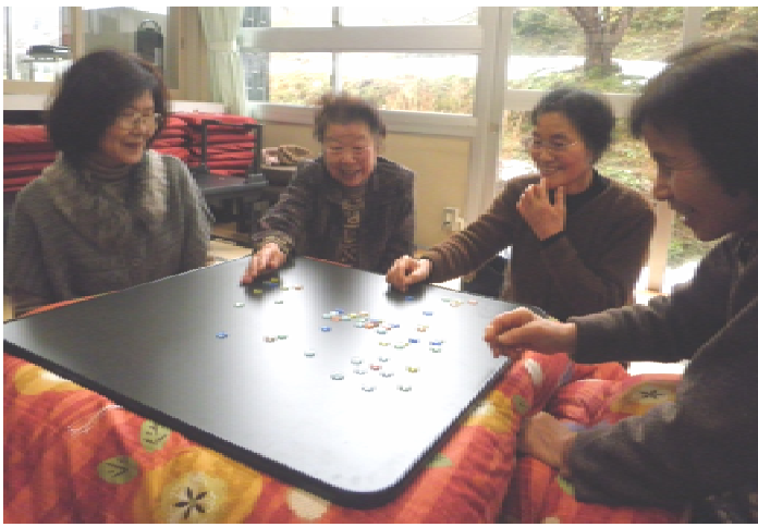
こうやって遊んだよね!!

途中、昔を懐かしみながら歌に合わせてお手玉をしたり、おはじきのルールを思い出しながら楽しめました。