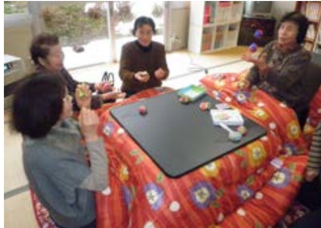
さすが! 皆さん、お上手ですね!!

「何十年ぶりにしたわ〜」童心に帰らせてもらったわ〜と言っておられました。最後に皆さんにアンケートをとり、希望等を聞きました。来年度の活動の参考にさせていただきますと思います。