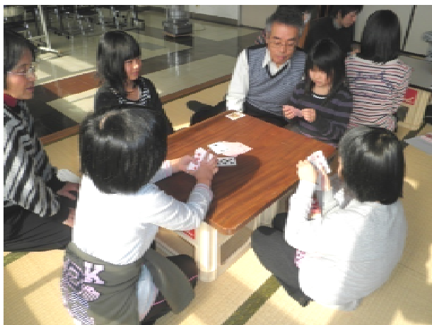
かけ引きがむずかしい・・・