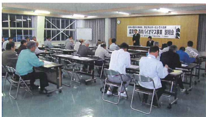
5月10日 説明会、於掛合総合センター

市民の皆さんが山に入り伐 採と残材収集を行う事で、山林 に光が射し、山が元気になる事 が期待されています。