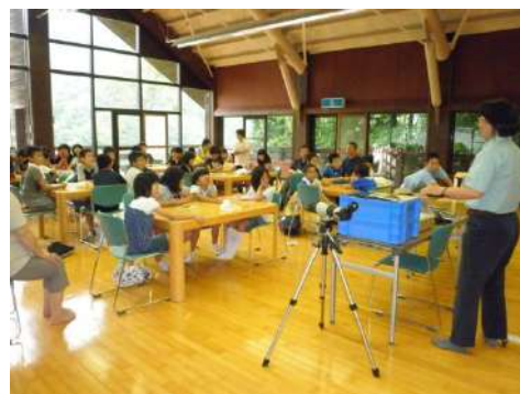
さえずりの森でバードウォッチング！