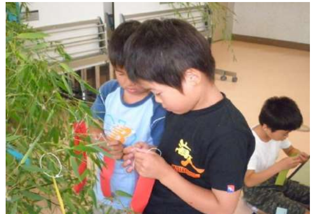
真剣にむすんでいますよ☆