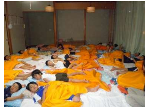
疲れてグッスリ(ー_)zzz