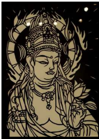
「観音菩薩」 福留幸夫