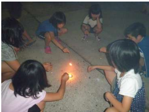
最終日の夜には花火♪♪