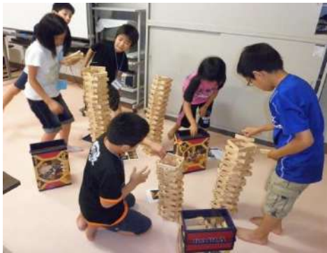
自由時間にはカプラに挑戦！

六月二十五日(月)から三十日(土)までの五泊六日、掛合交流センターを会場に掛合・松笠共催で、掛合小学校四年生を対象に通学合宿を行いました。初めての試みでしたが、大きな怪我も無く無事に終える事ができました。過ぎてみればあつという間の一週間で最後には『また来てもいいですか?』という声が聞かれ、とても嬉しかったです。 今回の通学合宿を通して、子どもたちが何か感じたり考えたりし、これからの生活に生かしてもらえたらと思います。