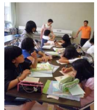
お家の人にお手紙書いたよ☆