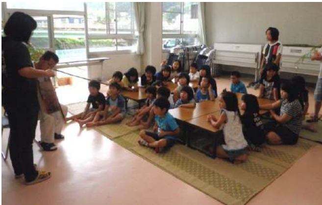
センター長による読み聞かせ♪♪

七月七日(土)、第二回目のみらいスクールを行い、今回は七夕会をしました。あいにくの天気でしたが、二十四人の子どもたちが参加してくれました。 まず始めに短冊に願い事を書き、七夕飾りを作りました。『なに書くのかな?』『こんなのできたら☆』との声が聞こえました。