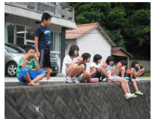
外で食べるスイカ(^-^)