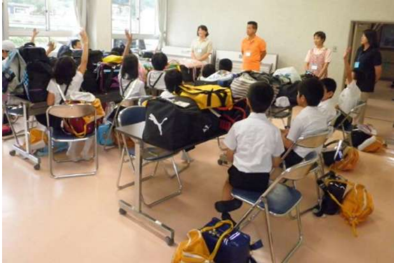
はじまりの会！みんなドキドキ☆わくわく☆

六月二十五日(月)から三十日(土)までの五泊六日、掛合交流センターを会場に掛合・松笠共催で、掛合小学校四年生を対象に通学合宿を行いました。初めての試みでしたが、大きな怪我も無く無事に終える事ができました。過ぎてみればあつという間の一週間で最後には『また来てもいいですか?』という声が聞かれ、とても嬉しかったです。 今回の通学合宿を通して、子どもたちが何か感じたり考えたりし、これからの生活に生かしてもらえたらと思います。