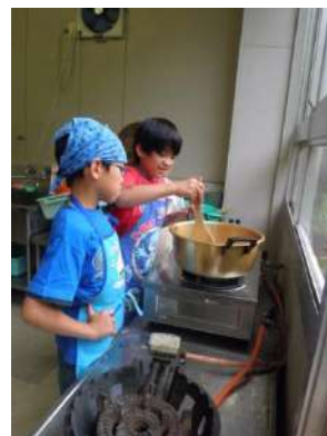
みんなで作ったよ!!(夕食)