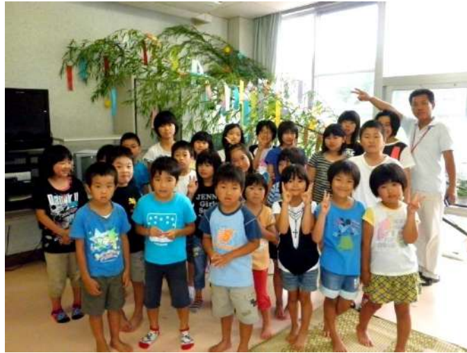
ささ飾りをバックに記念撮影(^^)v

その後、お楽しみとして、センター長による読み聞かせ&〇×クイズをしました。みんなのよく知っているアニメや交流センターのクイズに盛り上がりまりました。 みんなの願いが届くといいですね！