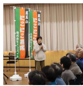
← 双葉亭ゆうやけさん