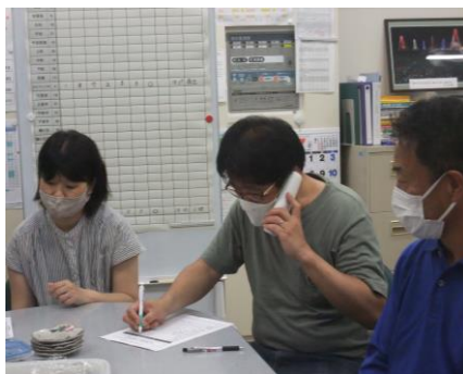
各自治会から報告を受ける

また、7月9日には安否確認情報伝達訓練を実施しました。19時のペーjing放送開始からほぼ1時間ですべての自治会から安否確認ができました。