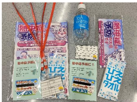
◆今回配布したもの◆