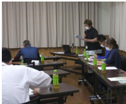
総合センターからの説明

大切なことは、 避難指示が出たら全員避難 することです。（宅内でもOK）質疑応答では、「指定避難所への移動が困難な方が増えている」「指定避難所の管理がどの様になっているのか不明」等の意見が出されました。