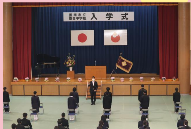
4/11 掛合中学校 入学式（14名）