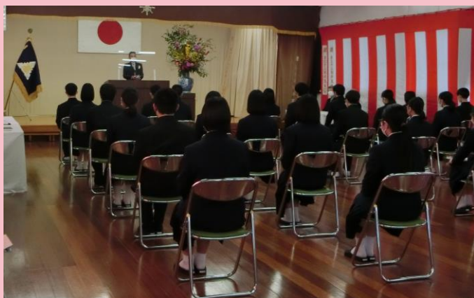
4/11 三刀屋高校掛合分校 入学式（30名）

かけや夢の子園、掛合小学校、掛合中学校、三刀屋高校掛合分校の新入生のみなさん ご入園、ご入学おめでとうございます♪ これからのご活躍をお祈りしています！