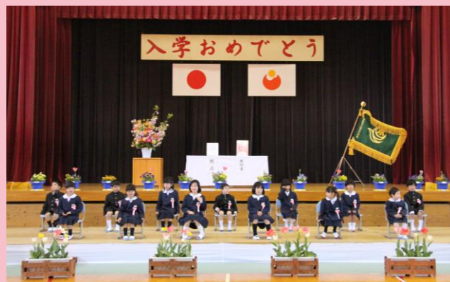
4/11 掛合小学校 入学式（13名）