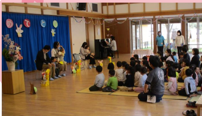
4/4 かけや夢の子園 入所の集い（2組）