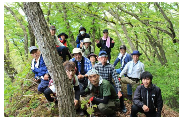
参加者全員で記念撮影