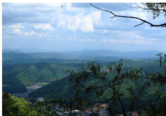
天気に恵まれ、最高の眺めでした♪