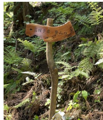
登山道入口の看板