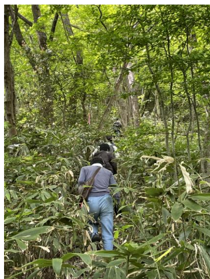
笹藪の中を登ります