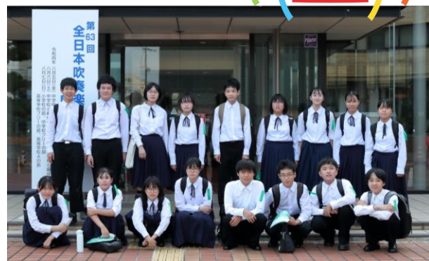
◆ コンクール会場での集合写真 ◆