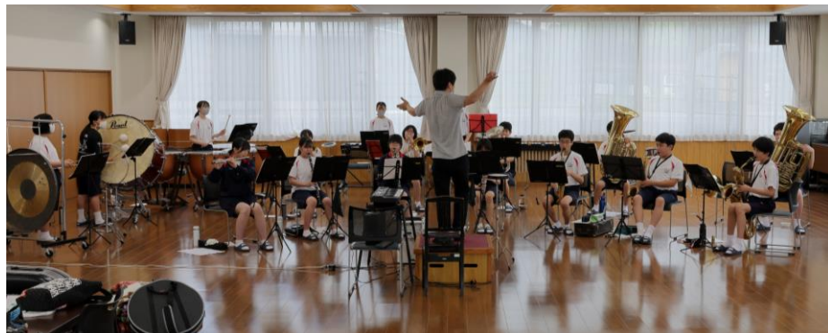
◆ 掛合交流センターでの全体練習 ◆