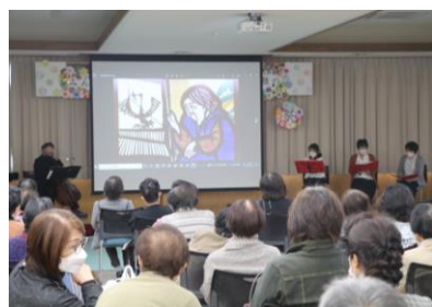
わくわくお話し隊