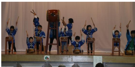
保育園児によるはやしこ太鼓