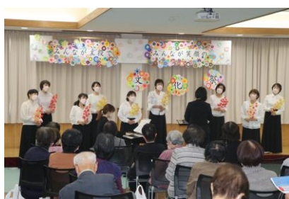
コールヨリージョ