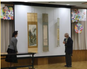
お茶席掛け軸の説明