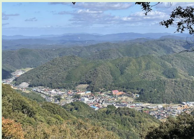
最高の眺めで、穴道湖まで見えました！