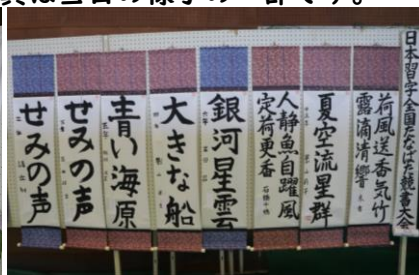
展 示 の 様 子