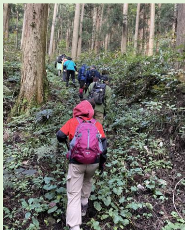
険しい道のりでした…