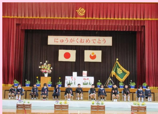
3/11 掛合小学校 入学式（新入生 13 人）