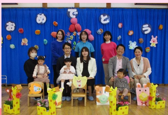
3/4 かけや夢の子園 入所のつどい（3 人）