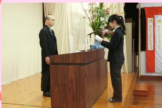
3/11 掛合分校 入学式（新入生 24 人）

かけや夢の子園、掛合小学校、掛合中学校、三刀屋高校掛合分校の新入生のみなさん ご入園、ご入学おめでとうございます♪ これからの新生活が楽しく実りあるものになりますように！