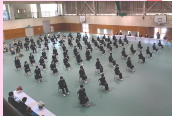
3/11 掛合中学校 入学式（新入生 15 人）