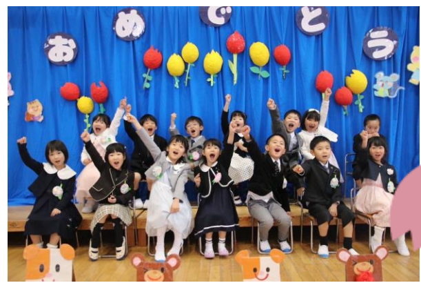
3/19 掛合保育所 修了式（卒園生 14名）