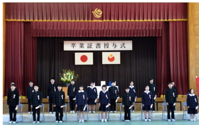
3/15 掛合小学校 卒業式（卒業生 18名）