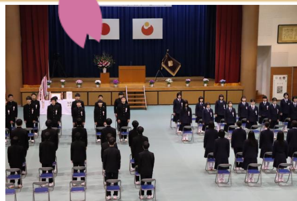
3/9 掛合中学校 卒業式（卒業生 25名）