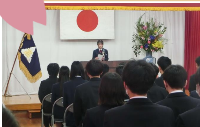
3/1 掛合分校 卒業式（卒業生 23名）

掛合保育所、掛合小学校、掛合中学校、三刀屋高校掛合分校の卒業生のみさん ご卒園、ご卒業おめでとうございます♪ 次のステップでのご活躍をお祈りしています！