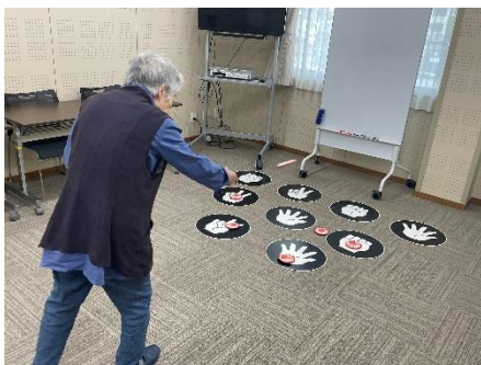
5月：じゃんけんペタンコ