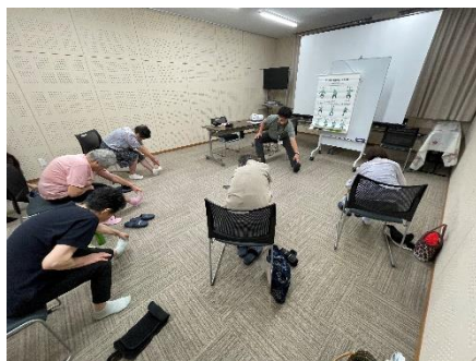
8月：幸雲南体操の体験