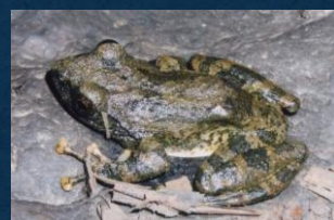
カジカガエルです!