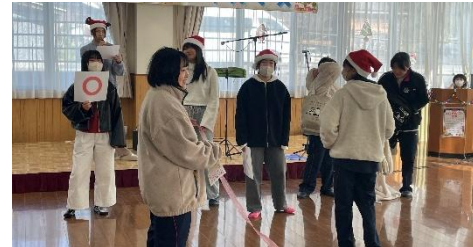
陽だまり館〇×クイズ

ステージイベントは「読書推進活動」として、旧読書会の皆さんやわくわくお話隊の皆さんによる、読み聞かせや朗読劇を迫力満点で公演いただきました。小さな子どもから大人まで、思わず見入ってしまう素敵な時間になりました。